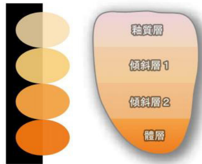
各層的色調・透光性