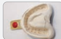
凝固硬化 自口內取出-白色