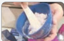
開始加水調拌-紫色