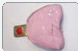
結束調拌 放置牙托-粉紅